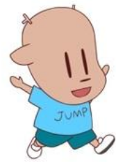
▲しか乃介 (しかちゃん) (鹿浜地域学習センターキャラクター)