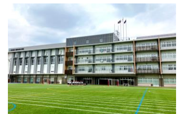
▲鹿浜未来小学校外観