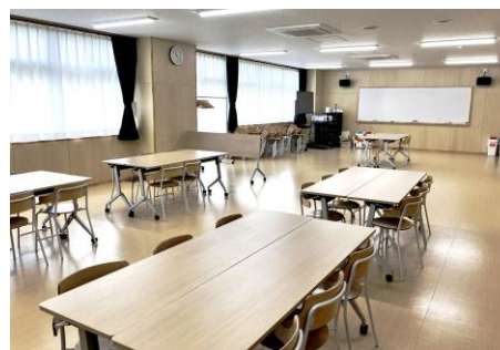
▲視聴覚室は流しも用意されておりランチスペースとしても利用されている。