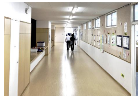
▲災害避難時の誘導やバリアフリーにも配慮された広々とした廊下