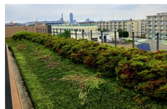
▲フェンスの先にある緑化コーナー