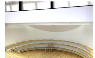
▲読み聞かせコーナー

図書室は「気軽に本に親しんでほしい」という思いから、児童の目に入る機会の多い昇降口正面に作られたそうです。閲覧席のほか、畳コーナー、ベンチなど読書スペースも充実。読み聞かせに使われる円形空間の(DEN)は、階段状になっていて舞台のように天井からスポットライトが当たります。