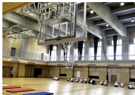
▲体育館にはバスケットゴールが半面と全面合わせて6つ設置されている。