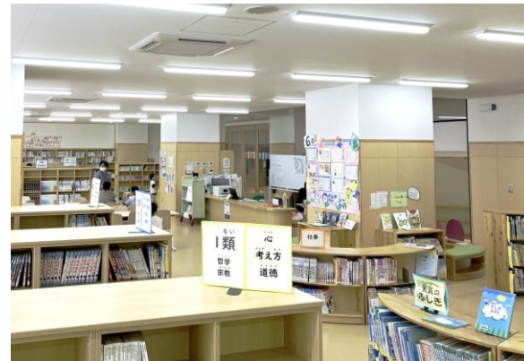
▲木のぬくもりを感じさせるやわらかな雰囲気の図書室