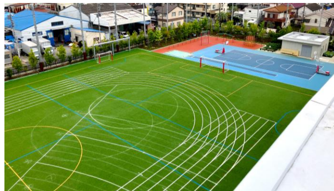
▲5階から見たグラウンドとバスケットコート