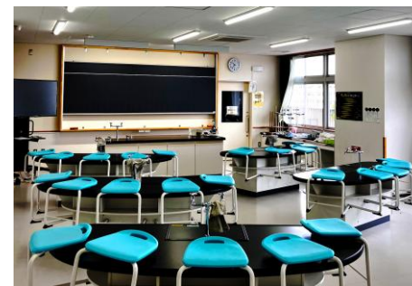
▲理科室にはバルコニーが併設されており、観察にも便利。椅子は実験台に座面を掛けて収納できる。