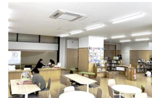
▲窓口と閲覧コーナー