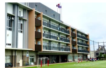
▲南向きにある普通教室とグラウンド