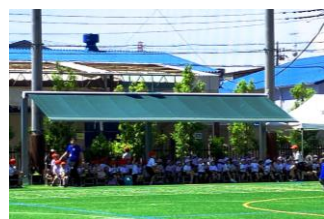
▲収納式の底の下で待機する児童

昇降口の目の前に位置するグラウンドには、歩き心地の良い人工芝が敷き詰められています。