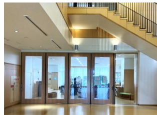
▲階段下の1階にある図書室入口

鹿浜未来小学校の昇降口に足を踏み入ると、そこには1階から2階をつなぐ大階段が佇んでいます。階段中央の天井には採光窓が設置されており、明るく開放的な空間となっています。大階段の中心部分はベンチとして座ることも可能。ここは、イベントスペースとしても使用されているそうです。