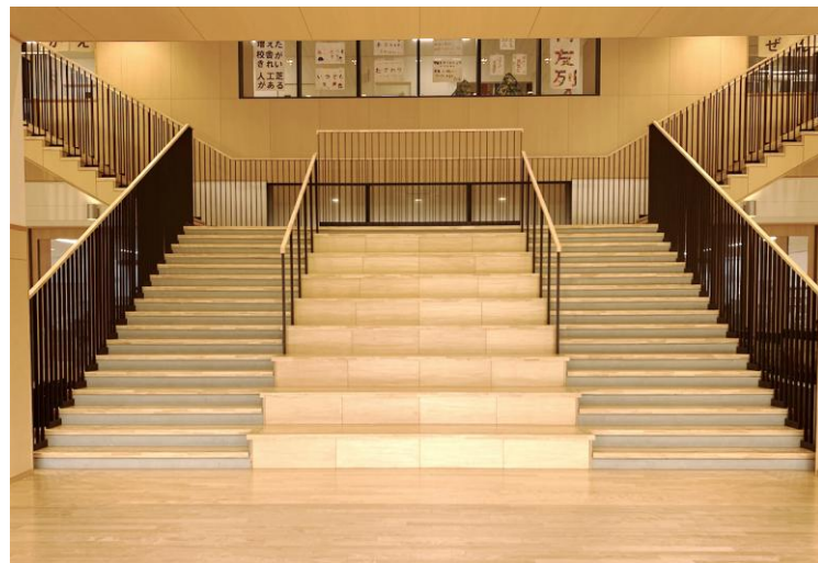
▲センターホールと大階段