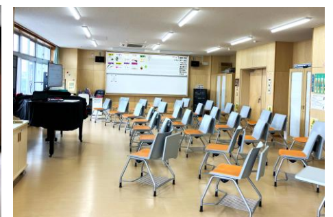
▲音楽室には収納とテーブル付きの椅子がズラリと並び、折り畳み式のため空間を広々と利用できる。