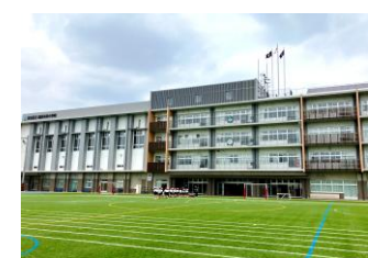
▲鹿浜未来小学校外観