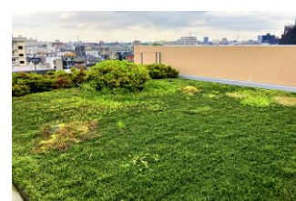
▲屋上や校庭の緑化で日射熱を緩和

鹿浜未来小学校ではユニバーサルデザインが取り入れられています。校舎内の緑化やソーラーパネルによるエネルギー活用も行われ、環境にもやさしい施設です。