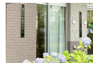
▲学童保育室の入り口

鹿浜未来小学校では、放課後こども教室と学童保育室を学校内に併設しています。児童は安全に放課後を過ごすことができます。