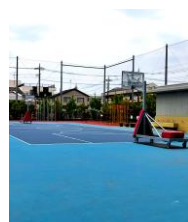
▲バスケットコート