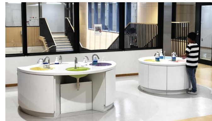
▲手洗いはセンサー式を採用、蛇口や洗面台に接触せず水を流すことができる。