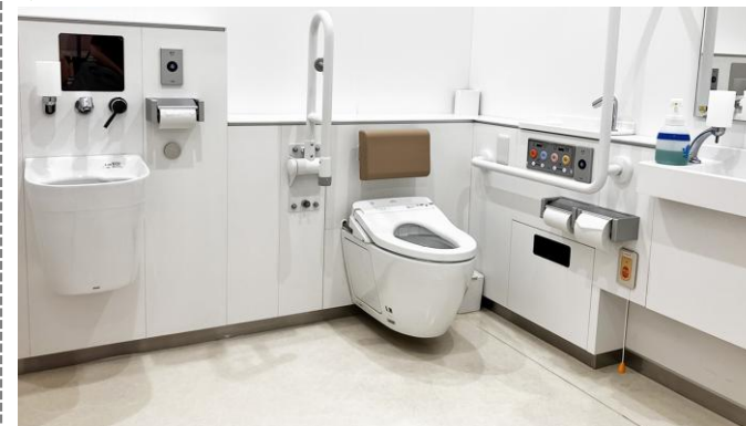
▲多機能トイレにはオストメイト対応設備や可動式手すり等が設置されている。