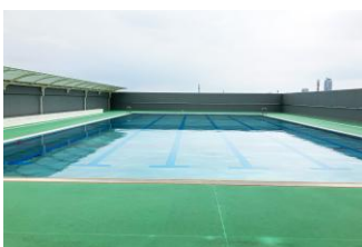
▲プールは屋上に配置されている。