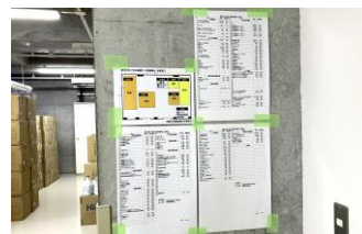
▲災害備蓄物品を一覧で管理

鹿浜未来小学校では、避難所となる体育館や放送・通信設備がある職員室、放送室、炊き出し支援が可能な家庭科室などを荒川氾濫時の浸水の際にも機能するよう、2階に配置しています。