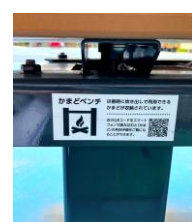
▲座板取り外し部分

屋外での炊き出し時には、バスケットコート脇にあるかまどベンチが活躍します。脚部分にかまどが収納されており、座板をはずして使用することができます。