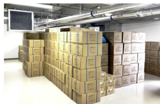
▲体育館に隣接した防災備蓄倉庫