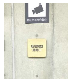
▲避難用階段は地域開放通用口へと繋がる。