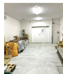
▲災害時使用の道具を1階防災備蓄倉庫に収納