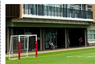
▲昇降口は段差がなくフラットな設計

感染対策のため、非接触型の手洗い器を設置しています。また、校舎は空気を循環させる構造となっており、換気対策に配慮されています。