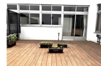
▲中庭を設け廊下の通風と採光を確保

感染対策のため、非接触型の手洗い器を設置しています。また、校舎は空気を循環させる構造となっており、換気対策に配慮されています。