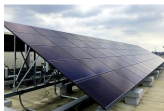
▲災害の停電時にも電力供給が可能

プールの水は災害時に消火用水として使用できるほか、仮設トイレの排水にも利用可能。ソーラーパネルによる太陽光発電があるため非常時にも電力が使えます。