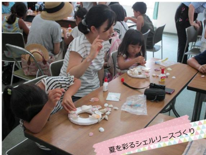
夏を彩るシェルリースづくり