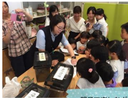
親子で楽しむギャラクシティツアー

今年の夏も鹿浜センターでは、様々なイベントや講座を開催しました。参加して下さった皆様の思い出をお届けします。